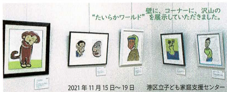
壁に、コーナーに、沢山の “たいらかワールド”を展示していただきました。