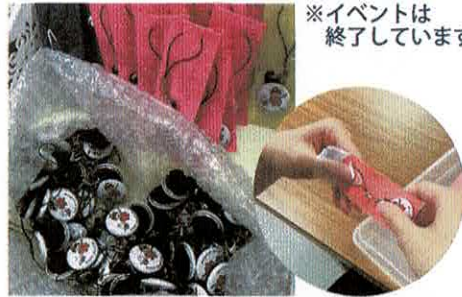
※イベントは 終了しています。