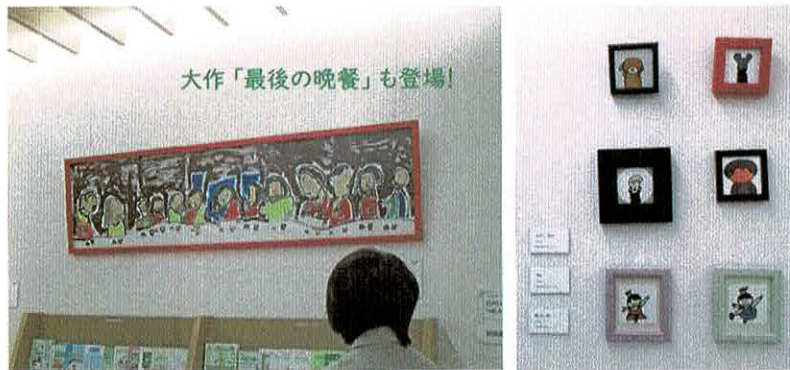
大作「最後の晩餐」も登場!

港区が主催するいじめ・児童虐待防止啓発ウィークの コラボレーション展「HEART & HEART ART」に、 たいらかから沢山のアート作品を出展させていただきました。