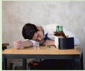
酔い度合いの確認に