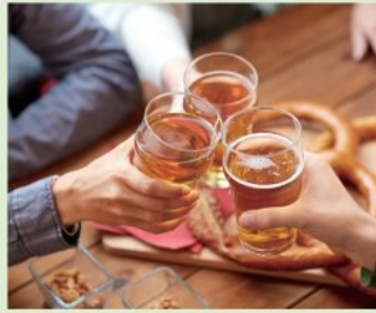
飲酒時や飲酒後、 その翌日の測定に