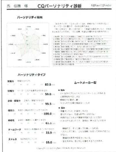
西社長の個性診断結果

「業績評価シートは、神奈川県横浜市に本社を置く総合代理店、既許顧客への生保保のスキル販売に注力する効果営業を行うことで業績一人あたりの生産性が100万円を越える同社だが、このほど人事評価のあり方をまったく新しいものに替え、狙いは、社員一人ひとりの成長度合いの可視化と数値化、そしてそれらをきちんと昇進・昇給の判断に反映させるといふ公平で公正な仕組みを構築し、一層の組織の拡充を図るためだ。新人人事評価制度の導入をはじめとした同社の組織力強化のための取組みを取材した。